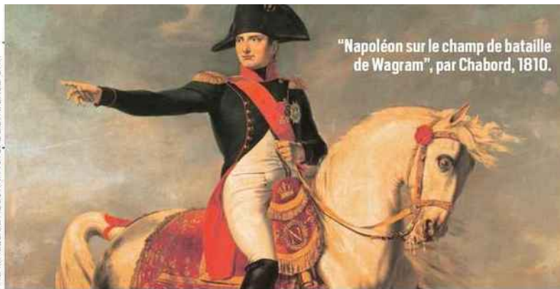
"Napoléon sur le champ de bataille de Wagram", par Chabard, 1810.

à une précaution prise par un pascalien de dernière heure. R. de S.