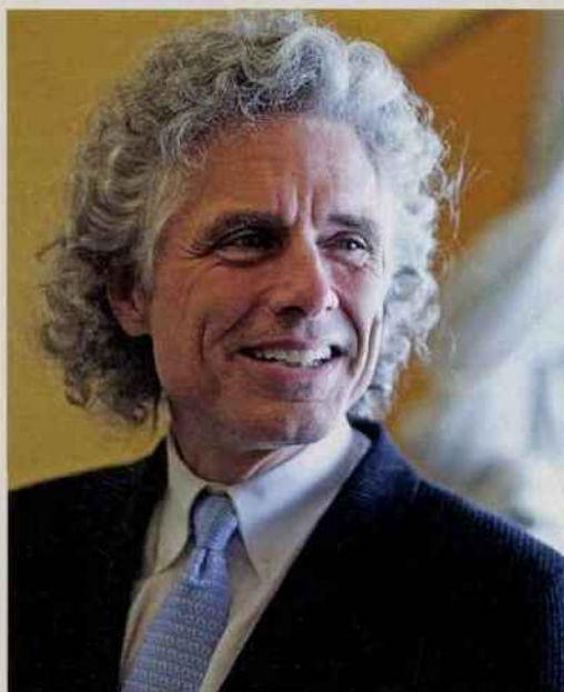
HARVARD UNIVERSITY / ED. LES ARÈNES