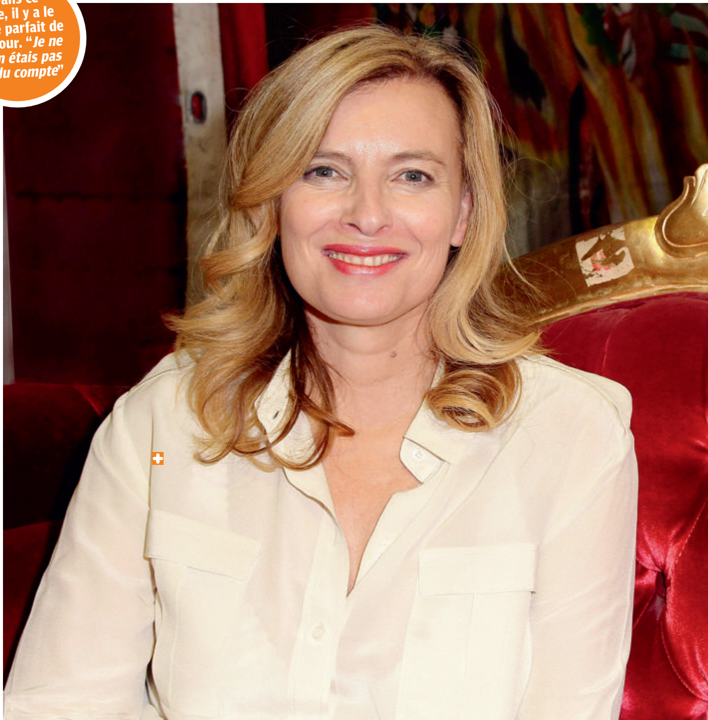
▶ Entre la vie d'Adèle, l'héroïne du premier roman de Valérie Trierweiler, et celle de l'ex-compagne du président français François Hollande, il y a com