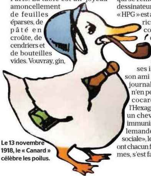
Le 13 novembre 1918, le « Canard » célèbre les poilus.